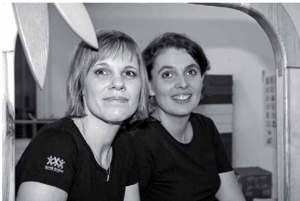
► Prosíme potlesk pro naše ředitelky!.

Diplomovou práci psala na téma Vývoj notářských úřadů v Čechách, což napovídá, že uvažovala o notářství. Věnovala se ale advokacii. I když ji nepovažuje za poslání, ale povolání jako každé jiné, chtěla by se k ní na stará kolena ještě vrátit. V Nové Trojce je prý ale zatím moc spokojená. Je fakt, že spokojených mladých kolen není nikdy dost.