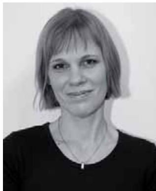
► Svědek s číslem 777650759.