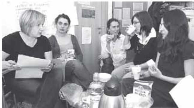
► Dokážou vůbec ještě plánovat nestrategicky?

(Jen pro silné náтуры, není vhodné pro lidi trpící alergií na lejstra! Pozor, nuda a úředničina, Brepta by usnul, kreativci, obraťte list...)