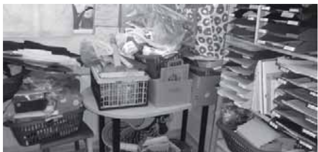
► Tak takhle už to v zázemí pro dobrovolníky díky novým skříním nevypadá...

Cena nových skříní v zázemí, na které byl použit výtěžek z dražby fotek při červnových narozeninách N3, výtěžek z podzimní burzy a peníze z grantů MPSV a Prahy 3.