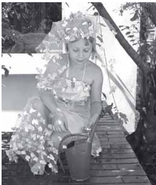
► Nová zahrádka byla při narozeninách N3 v zajetí letních vil...

Nelze přehlédnout dva půdokryvné keře – něžný jasně modře kvetoucí barvínka menší ( Vinca minor ) a bíle kvetoucí skalník trnitý ( Cotoneaster dameri ), ten roste zcela vlevo pod vzrostlým myrobalánem. Další plochy zde pokrývá žlutě kvetoucí třezalka a na jaře několik skupin narcisů . Dalším keřem, použitým i na stálezketoucích záhonech, je hortenzie.