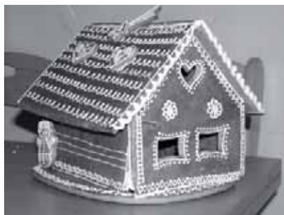
► Kdo si troufá na chaloupku?

Můžeme slepovat Nutelou a zdobit rozehrátou bílou a tmavou čokoládovou polevou a ty rozpíjet špejli do sebe. Dokonalejší variantou náplně je ořechový máslový krém s nastrouhanou pomerančovou kůrou.