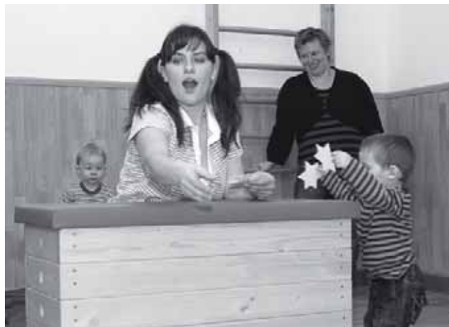
► Žijící legenda N3 tradičně v akci při tradiční akci.