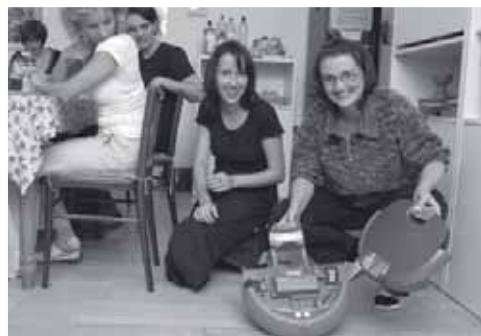
► Robůteček hýčkaný dvěma Ivankami...