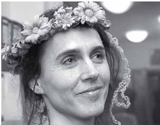
► Při loučení s Dančou zvlhlo leckteré oko.