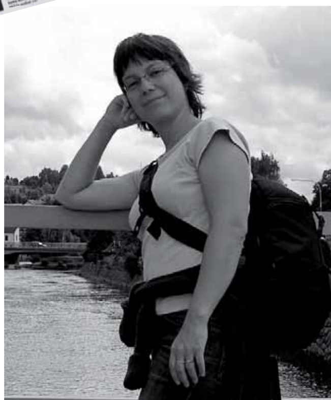
► Rejka. Žena s citem pro krásno a webové kreaće.